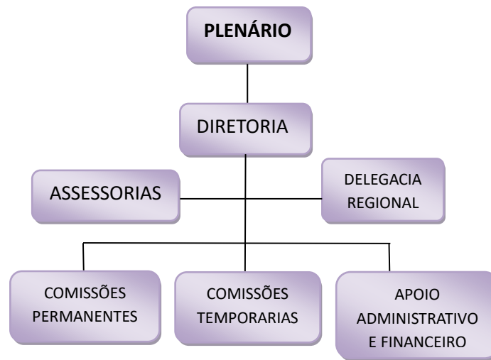
Figura 1 – Organograma do CRB-3