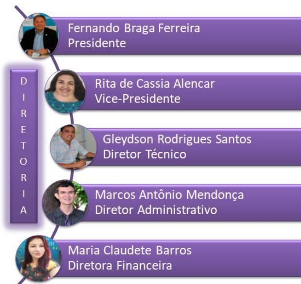
Figura 2 – Diretoria 2019

A Diretoria do CRB-3 é composta pelo Presidente, Vice-Presidente, Diretor Técnico, Diretor Administrativo e Diretor Financeiro. Suas competências podem ser consultadas no Capítulo II – Dos Órgãos Executivos dos Conselhos do RI. Disponível em:< https://www.cfb.org.br/ >. Acesso em 14 ago. 2020.