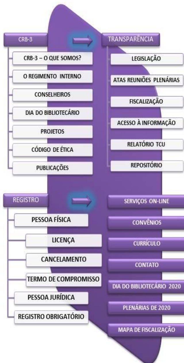
Figura 3 – Estrutura do Site