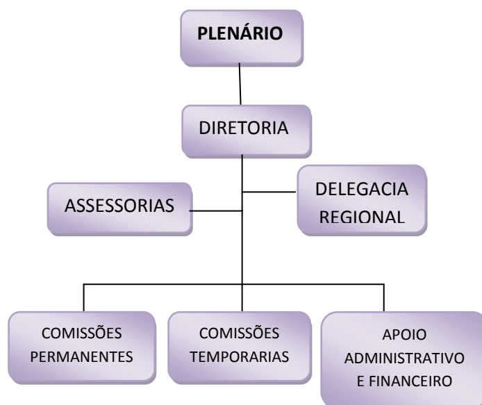
Figura 1 – Organograma do CRB-3

A Estrutura organizacional é o elemento funcional para que o CRB-3 mantenha o foco nos seus objetivos, depois de definidos a missão, os objetivos e os valores que servem de base para suas atividades, por meio dos órgãos da estrutura organizacional apresentada no organograma a seguir: