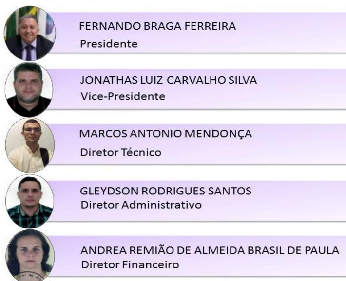
Figura 2 – Diretoria 2018

A Diretoria do CRB-3 é composta pelo Presidente, Vice-Presidente, Diretor Técnico, Diretor Administrativo e Diretor Financeiro. Suas competências podem ser consultadas no Capítulo II – Dos Órgãos Executivos dos Conselhos do RI. Disponível em:< https://www.cfb.org.br/ >. Acesso em 29 abr. 2019